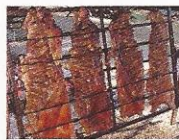
Tavola Fredda Servizio Bar SABATO 25 AGOSTO ore: 19.00